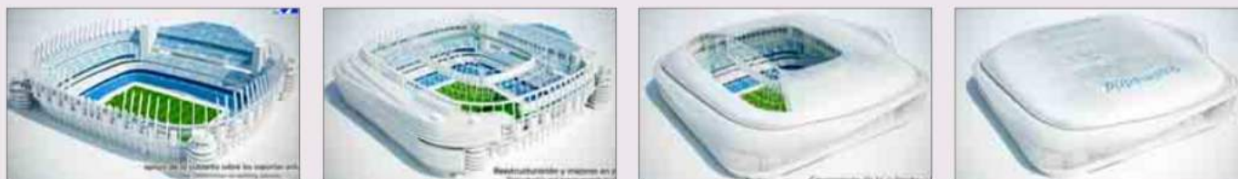
Secuencia de las distintas fases de la remodelación del estadio, desde la colocación de la nueva cubierta hasta el despliegue de la piel de titanio que cubrirá todo el edificio.