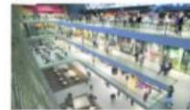
Videomarcador de 360°